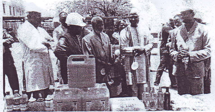
Le ministre de l'Education nationale et de l'Alphabétisation attentif aux processus de production de l'huile et autres produits dérivés de la SN CITEC